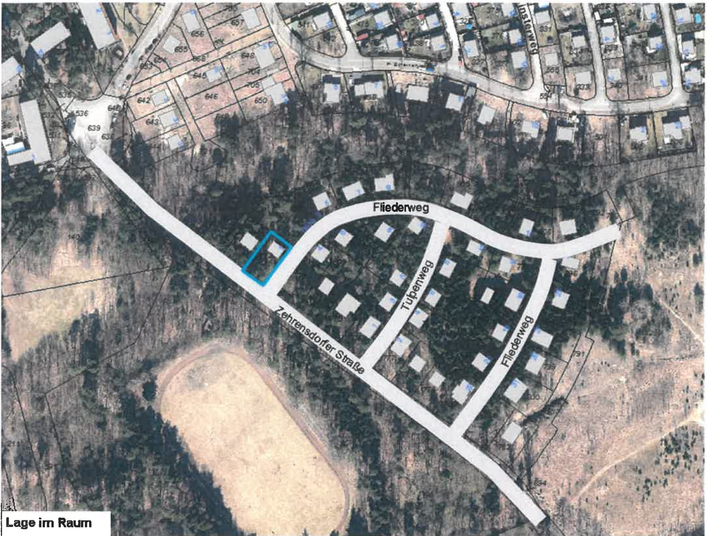
Lage im Raum

2.1 An den gekennzeichneten Stellen (+/- 2 m) sind standortheimische klein- bis mittelkronige Laubbäume mit einem Stammumfang von 18 - 20 cm anpflanzen.