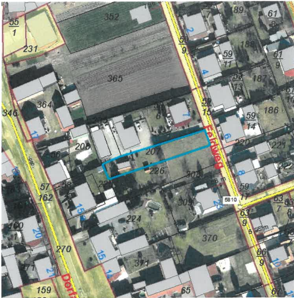
Ausschnitt aus dem GIS