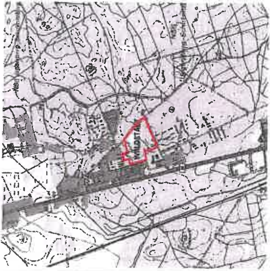
Übersichtskarte (ohne Maßstab)