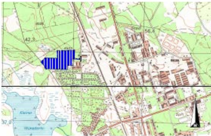
ÜBERSICHTSKARTE M 1 : 20.000