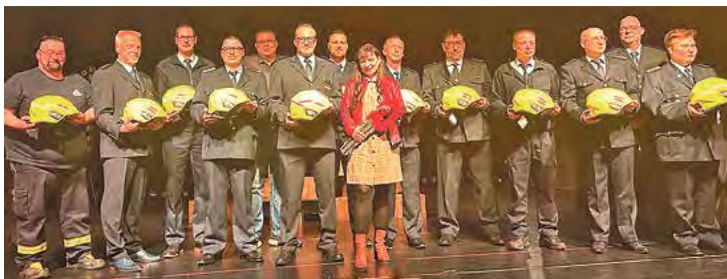
Zur Jahreshauptversammlung wurden neue Helme für die Feuerwehr der Stadt Zossen übergeben.

für über 140.000 Euro – ein starkes Zeichen für die Sicherheit unserer ehrenamtlichen Einsatzkräfte. Vielen Dank für euren täglichen Einsatz!