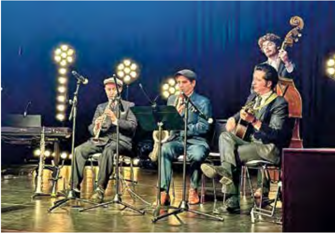
Die Band „The Big Five“ brachten Swing auf die Bühne.