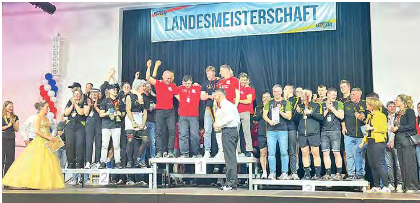
Eine rundum gelungene Veranstaltung, bei der es gefühlt nur Sieger gab.

» 500 Gäste, 270 Tänzer und ein ausverkauftes Kulturforum bei den Ostdeutschen Meisterschaften – mit spektakulären Choreografien und bester Stimmung gingen am 14. März 2026 im Kulturforum Dabendorf die Ostdeutschen Meisterschaften im Herrenballett über die Bühne.