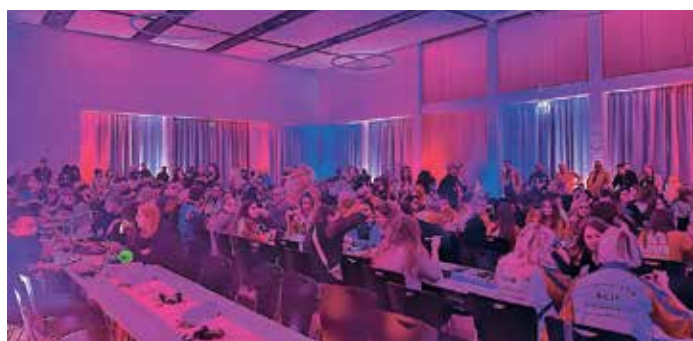
500 Gäste verfolgten die vier Showblöcke der Meisterschaft im ausverkauften Kulturforum Dabendorf.