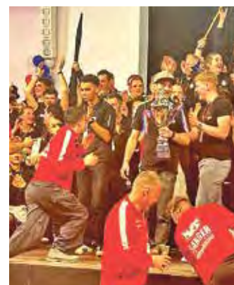
Das Siegerteam aus Markranstädt konnte sich auch über den Pokal der Stadt freuen.