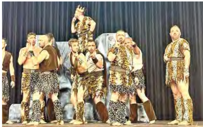
Die DKC Gentlemen begeisterten als Steinzeitmänner mit ihrem Programm „Feuer, Rad und Bier“ und belegten Platz vier.

Das Fazit des Abends ist eindeutig: Ein rundum gelungener Wettbewerb mit begeistertem Publikum und hervorragender Organisation.