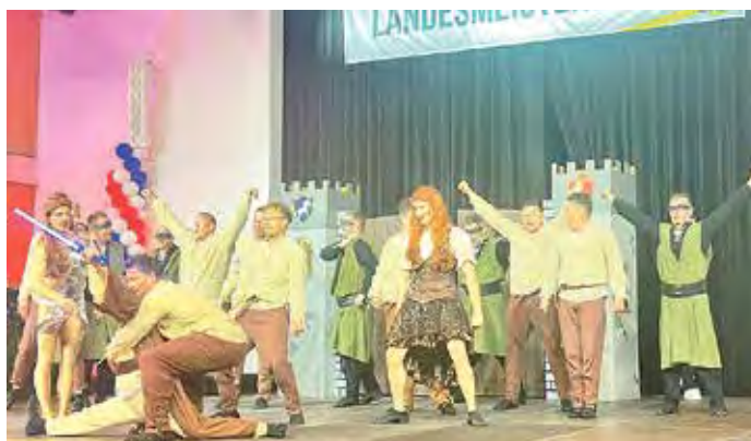
Der Markranstädter Carnival Club gewinnt mit seinem Programm „Camelot“ die Ostdeutschen Meisterschaften im Herrenballett in Dabendorf.