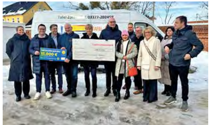
Feierliche Übergabe der Spenden für das neue Kühlfahrzeug der Tafel Zossen

Die Tafeln leisten einen unverzichtbaren Beitrag zur sozialen Unterstützung zahlreicher Menschen in der Region. Gerade der Transport gekühlter Lebensmittel stellt hohe Anforderungen an Logistik und Ausstattung. Das neue Kühlfahrzeug schafft hier verlässliche Rahmenbedingungen und erhöht die Planungssicherheit für die ehrenamtlich Engagierten. „Die Unterstützung der Tafeln ist ein starkes Zeichen gelebter Solidarität. Das neue Kühlfahrzeug verbessert die logistischen Mög-