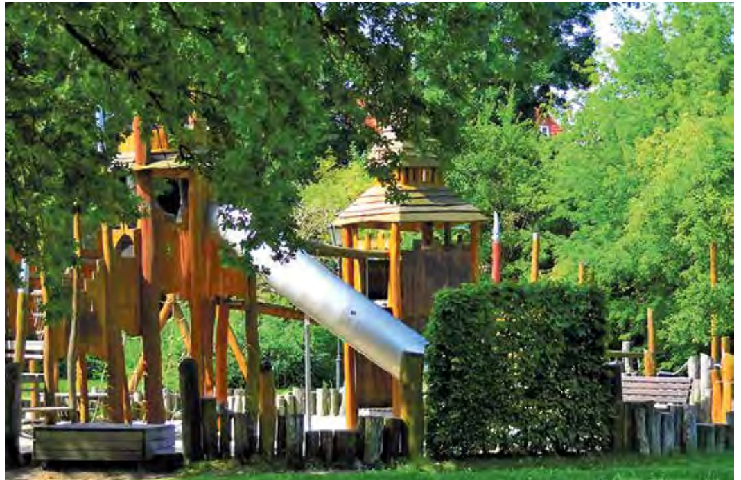
Der Spielplatz im Zossener Stadtpark

Kinderspielplätze sind für Hunde tabu. Das Mitführen von Hunden ist dort ausdrücklich verboten – egal ob an der Leine oder nicht. Hintergrund: Kinder spielen oft am Boden und sollen vor Keimen und möglichen Verletzungen geschützt werden.