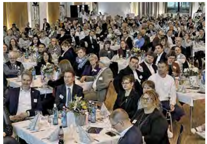
Das Kulturforum war auch in diesem Jahr wieder sehr gut besucht.