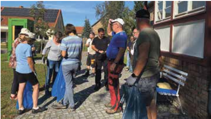
In Horstfelde hieß es am Samstag: „Ran an den Müll!“

» Am Wochenende vom 19. und 20. September war es wieder so weit: Zossen packte an! Ob in den Schulen oder in den Ortsteilen – beim World Cleanup Day wurde fleißig gesammelt, geschleppt und sauber gemacht. Besonders beeindruckend war der Einsatz der Goethe-Grundschule Zossen. Am Freitag, den 19. September, zogen 18 Klassen mit rund 418 Schülerinnen und Schülern los, um auf dem Schulgelände und in der Umgebung Müll einzusammeln. Das Ergebnis kann sich sehen lassen: Sage und schreibe 795 Kilogramm Abfall wurden gesammelt und in 90 prall gefüllten Müllsäcken entsorgt. Auch die Comeniuschule Wündorf beteiligte sich tatkräftig. Ab 9:15 Uhr war die Klasse 9a in der Chausseestraße unterwegs, während die Klasse 9b in der Berliner Allee, rund um das Bürgerhaus sowie zwischen