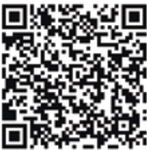
Events im Stadtgebiet

19.30 Uhr Rosenmontag Karneval Kallinchen Hotel & Restaurant Alter Krug, Hauptstraße 15, 15806 Zossen OT Kallinchen