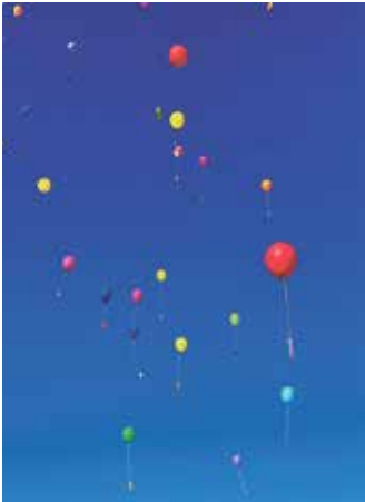
Zum Abschluss stiegen traditionell wieder bunte Luftballons mit Lesekartchen in den Himmel.

Zum Abschluss ließen die Kinder traditionell Namenskartchen mit Buchempfehlungen an (kompostierbaren) bunten Luft-