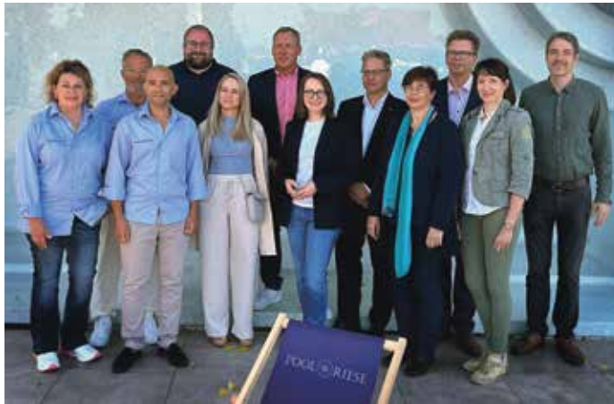
Die Zossener Firma Poolriese erhielt Besuch von der IHK-Kommission. Das Unternehmen ist für den diesjährigen Wirtschaftspreis nominiert.

Am 11. September 2025 war die Jury des Wirtschaftspreises zu Gast bei der Poolriese GmbH in der Nächst Neuendorfer Landstraße 55a. Dieses Unternehmen ist nicht nur in Zossen, sondern auch weit über die Region hinaus für seinen exklusiven Poolbau bekannt. Die Vertreterinnen und Vertreter der IHK Potsdam, der Kreishandwerkerschaft Teltow-Fläming, der VR Bank Fläming-Elsterland eG und der Mittelbrandenburgischen Sparkasse erhielten bei ihrem Besuch einen umfassenden Einblick in die Geschichte und Entwicklung des Unternehmens. Die Poolriese GmbH hat sich auf die Umsetzung individueller Poolwünsche spezialisiert und erfüllt ihren Kundinnen und Kunden die größten Wünsche rund um maßgeschneiderte Schwimmbecken. Dabei setzt das Unternehmen auf persönliche Beratung, einen persönlichen Ansprechpartner und eine außergewöhnlich schnelle Lieferzeit von nur 4 bis 6 Wochen. Qualität und Service stehen hier an erster Stelle – sowohl bei der Planung als auch bei der Ausführung. Das Unternehmen besticht durch seine Innovationskraft: Ob außergewöhnliche Formen, Farben oder hochentwickelte Technik –