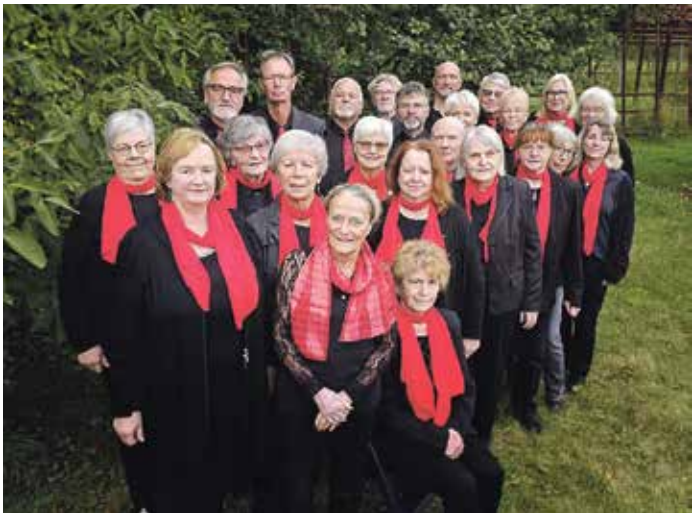
Der gemischte Chor Dabendorf e. V.

Zum Repertoire gehören klassische und moderne Chorsätze wie „Audite Silete“, „Ave verum“, „Advent ist ein Leuchten“, „Tausend Sterne sind ein Dom“, „We Three Kings of Orient Are“ und viele weitere beliebte Weihnachtslieder. Das Konzert ver-