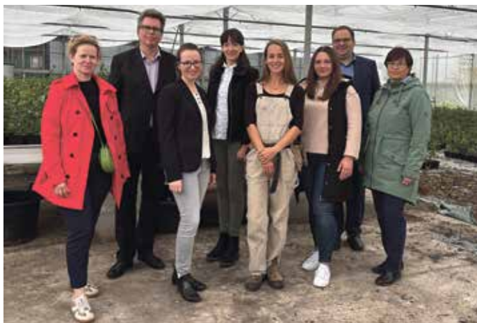
Die Jury war beeindruckt von der Führung über das rund sechs Hektar große Gelände von Growing Karma.