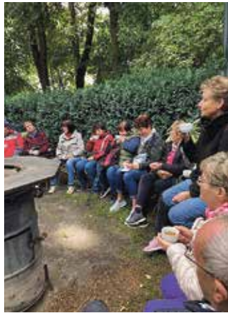
Giftige von essbaren Pflanzen zu unterscheiden – das lernten die Teilnehmenden beim Kräutererlebnis.

» In der Natur zu überleben erfordert die Nahrungssuche nach essbaren Pflanzen. Wichtig ist das Wissen, giftige von essbaren Arten zu unterscheiden, da viele Pflanzen und Pilze eine Verwechslungsgefahr mit giftigen Doppelgängern darstellen. Viele unscheinbare Pflanzen sind essbar und reich an Vitaminen und Mineralien. Dazu gehören Brennnessel, Löwenzahn, Giersch und Vogelmiere. Auch die jungen Triebe von Fichten und Tannen sind eine Quelle für Vitamin C. Nüsse wie Walnüsse, Haselnüsse und Eicheln sowie Samen liefern wertvolle Kalorien und Nähr-