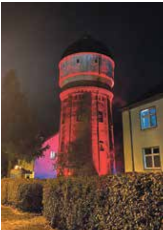
Impressionen vom Halloween am Wasserturm aus dem Jahr 2024

Stefan Christ ☎ 03377/300 189 ☎ 0176/96 07 46 18 E-Mail: stefan-christ@freenet.de ► Sprechzeit: nach tel. Absprache