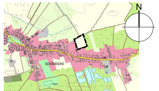
Geobasisdaten©GeoBasis-DE/GLB 2021 Maßstab 1 : 20 0000