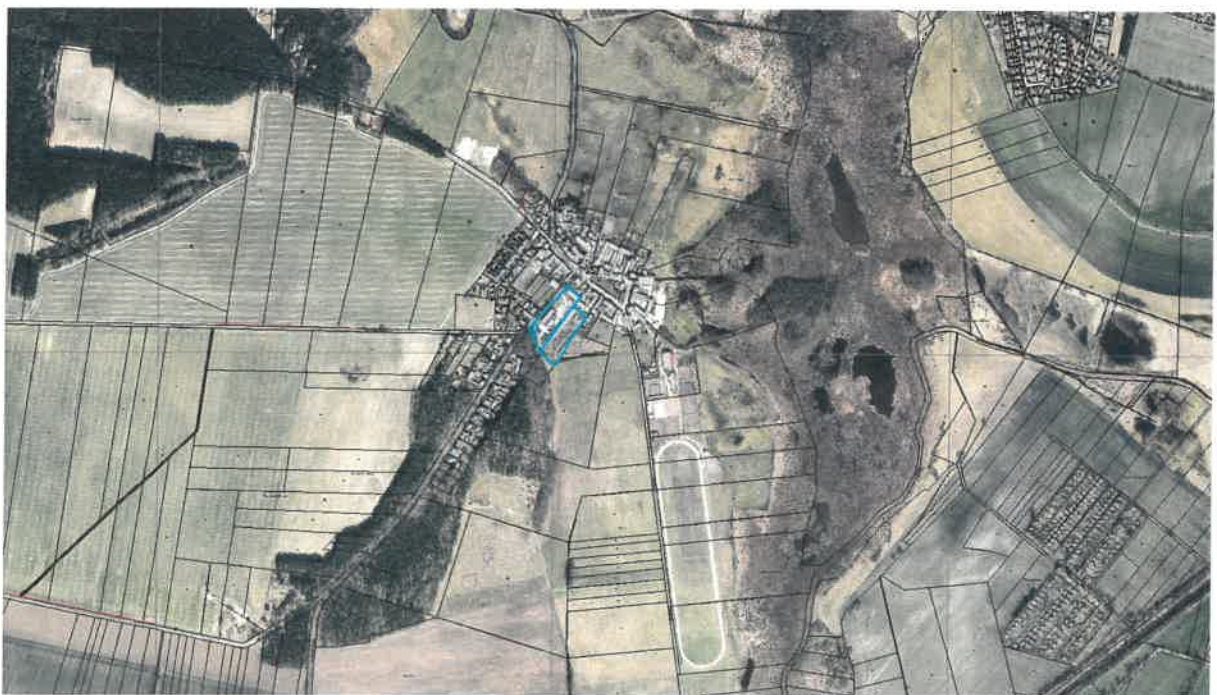
Übersicht zur Lage