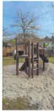
Stadt Zossen, die Bürgermeisterin