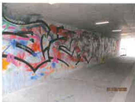
dies ein Blick in den bereits übernommenen Tunnel