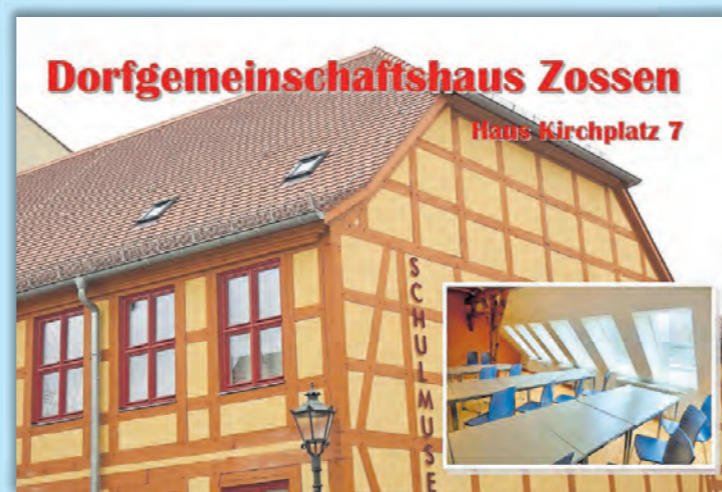
Dorfgemeinschaftshaus Zossen Haus Kirchplatz 7

staltungen. Nicht zu vergessen das Bürgerhaus in Wünsdorf, das über die größten Platzkapazitäten verfügt. Weitere Dorfgemeinschaftshäuser gibt es auch in Kallinchen, Schöneiche und Neu- hof. Für private Feiern genutzt werden kann auch der Gastraum der Dabendorfer Sporthalle an der Jägerstraße. Geld für zwei weitere Objekte in den Ortsteilen Schön- ow und Lindenbrück wurde übrigens im kürzlich verabschiedeten ersten Nachtragshaushalt der Stadt eingestellt. Künftig sollen auch hier Möglichkeiten entstehen, sich bei bestimmten Anlässen zu treffen und zu feiern.