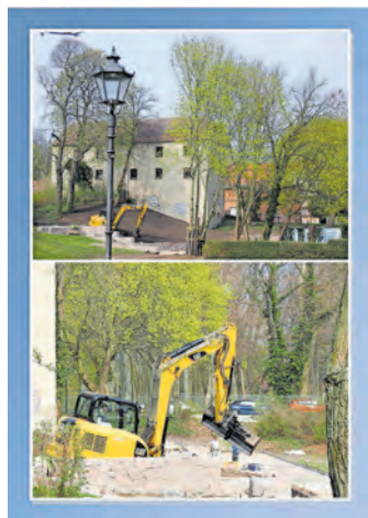
Bauarbeiten im Rosengarten

teile teilweise neu aufgebaut, um ein einheitliches und harmonisches Bild zu erhalten. Die Tragschichten sind eingebaut und mit dem Verlegen der Polygonalplatten wurde begonnen. Für die Umgestaltung der Nordhälfte des Stadtparks liegt den Stadtverordneten eine Beschlussvorlage zur Abstimmung vor (siehe Seite 15). Die dazwischenliegenden Flächen sollen eventuell als Repräsentationsflächen für verschiedene Landschaftsgärtner dienen.