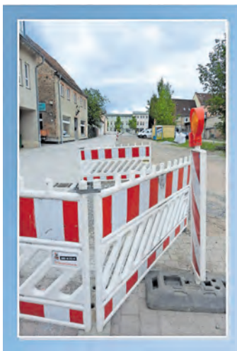
Die Sanierung der Rosengasse steht vor dem Abschluss.

Sanierung Rosengasse in Zossen: Der Einbau des Pflasters in Straße und Gehweg ist fast abgeschlossen. Im Anschluss sollen die Lampen und die Beschilderung ein- bzw. angebaut werden.