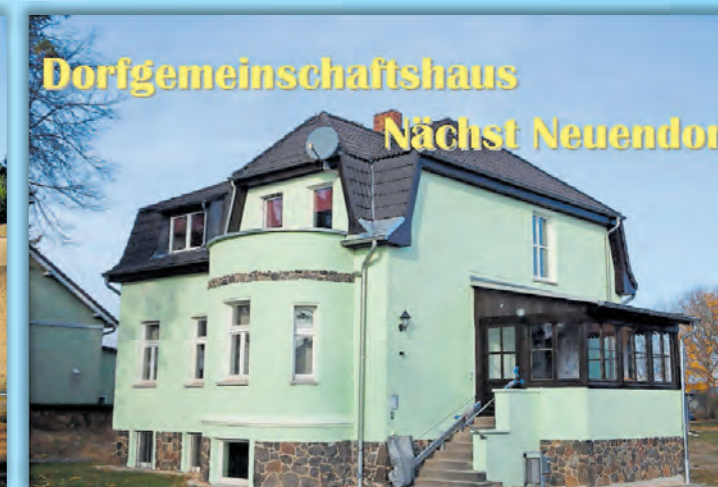
Dorfgemeinschaftshaus Nächst Neuendorf

Dorfgemeinschaftshaus Nächst Neuendorf, 15806 Nächst Neuendorf, Nächst Neuendorfer Landstraße 27