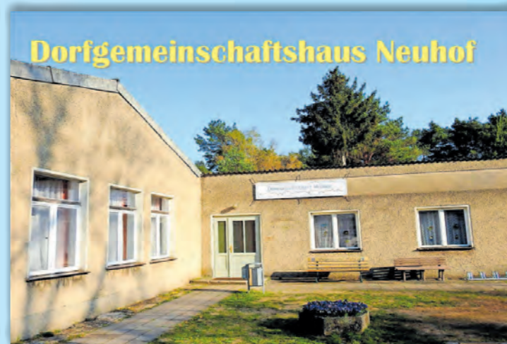
Dorfgemeinschaftshaus Neu- hof

Dorfgemeinschaftshaus Neu- hof, 15806 Neu- hof, Neuhofer Dorfstraße 24/25