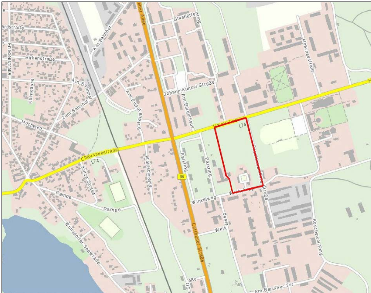
Lage des Plangebietes