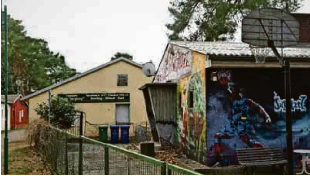
Vereinsheim und Jugendklub auf dem Wünsdorfer Burgberg.