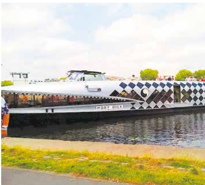
Der Ausflugsdampfer „Moby Dick“ legt an.

Der Vorstand der Volkssolidarität, Ortsgruppe Wünsdorf hatte am 30. Juni zu einer Dampferfahrt eingeladen. Es hatten sich sehr viele gemeldet, aber leider konnten nur 30 Senioren und Seniorinnen mitfahren, da der Bus nur 30 Personen fasste. Pünktlich um 9.30 Uhr ging es los zum Treptower Hafen, wo uns Moby Dick, ein imposantes Schiff, erwartete. Neugierig nahmen wir in dem „Maul des riesigen Hais“ dem Salon des Schiffes Platz. Und nun ging es los. Man genoss die schöne Seenlandschaft, die