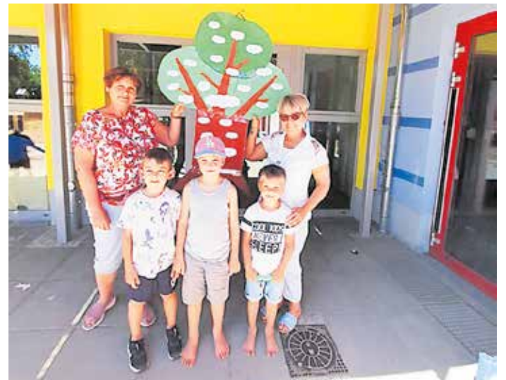
Kinder und Erzieher der Kita „Haus der kleinen Füße“ in Wünsdorf vor ihrem „Ideenbaum“.