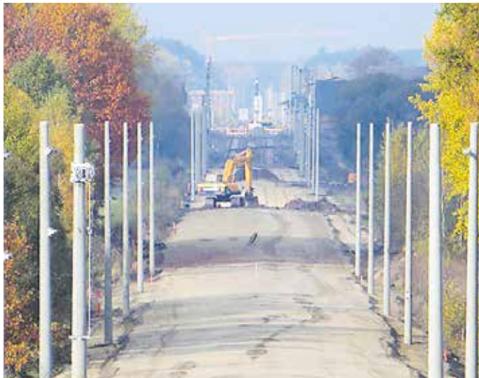
Blick auf das DB-Projekt Ausbaustrecke Berlin-Dresden.